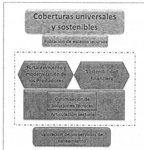
Gráfico N° 2 Esquema de la Política Nacional